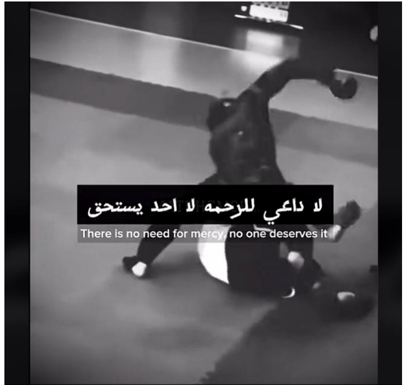
© The actions in this video are performed by professionals or supervised by professionals. Do not attempt.