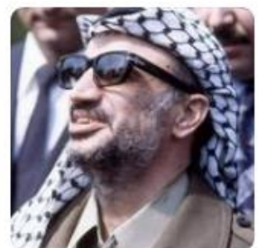
and hope remains